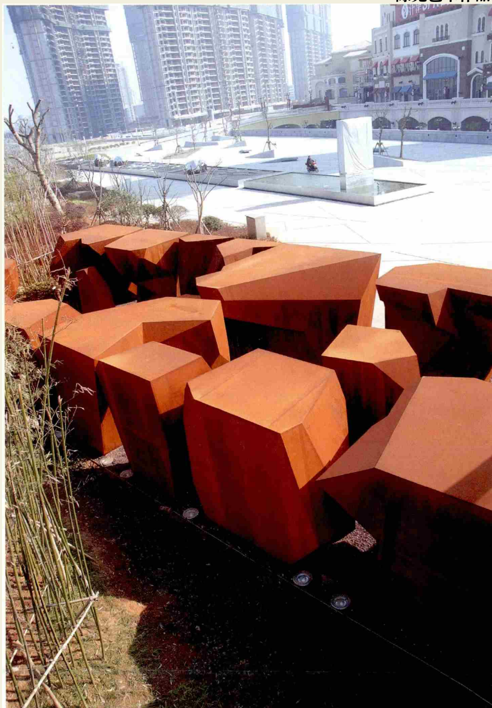
《荆棘之路—石阵》 2009年 南昌市紫金城利玛窦广场 130×10×3.5米 耐候铁、不锈钢、铜